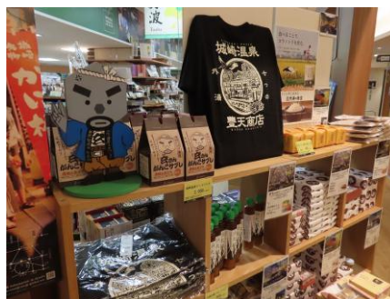
地域応援キャンペーン“行こう城崎!”