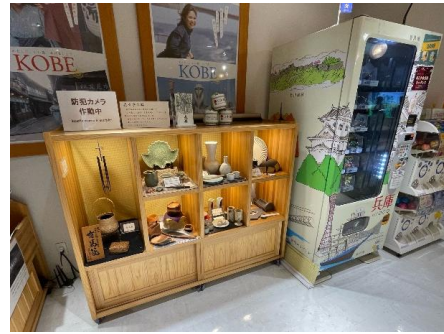
伊丹空港内での展示(10月末終了)