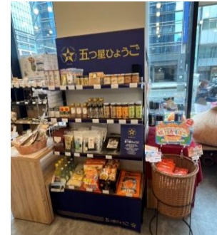
道の駅但馬のまほろば(朝来市) パルシェ香りの館(淡路市) 日本橋室町すもと館(東京都)