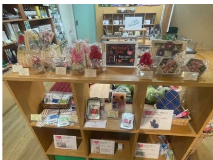
母の日(5月)関連商品の展示