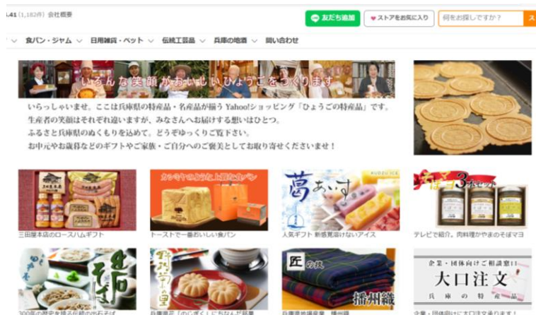
オンラインショップ「ひょうごの特産品」ホームページ

また、ひょうごふるさと館の公式 Instagram「ひょうごふるさと館（アカウント：hyogo_furusatokan）」や五つ星ひょうごの公式 Instagram「五つ星ひょうご（アカウント：5stars_hyogo）」などの SNS を活用した情報発信を行い、兵庫の特産品を広く周知するとともに、販売の拡大に努めた。