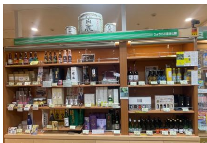
ふるさと館内 酒類販売コーナー