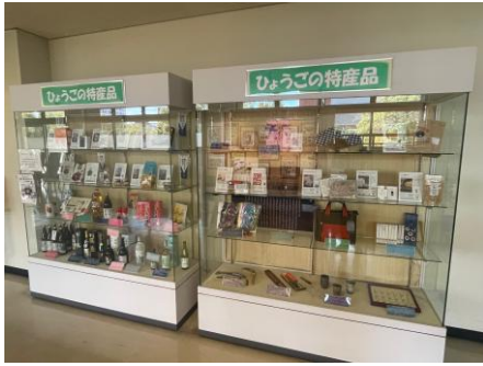
兵庫県庁舎内での展示

兵庫県庁舎及び伊丹空港 INFORMATION ひょうご・関西において伝統的工芸品やふるさと自慢の産品72点（県庁舎39点、伊丹空港「兵庫の器」33点）を展示した。