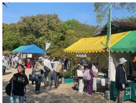
ひょうごの食と物産フェア

「ひょうごの食と物産フェア」については、大阪・関西万博のプレイベント「淡路花博25周年記念 淡路花みどりフェア2025」における催事として開催した。