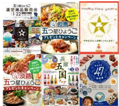
五つ星ひょうご公式 Instagram