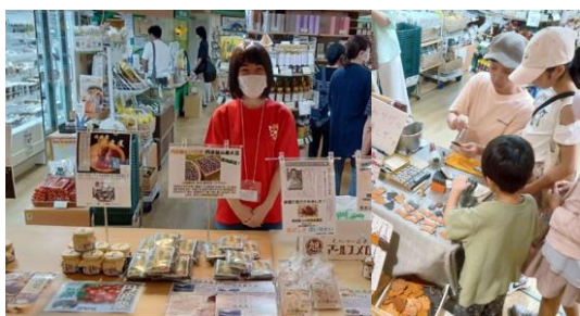
会員企業による特産品の対面販売

地域の商工観光団体や事業者が、館内のイベントコーナーを活用して、特産品のPRや販売、観光情報等を提供した。